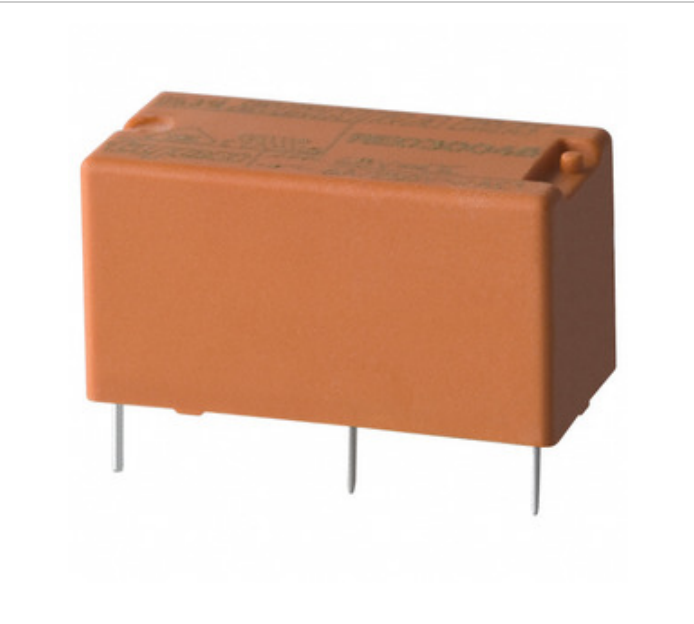
Image ကိုကိုယ်စားပြုဖို့အတွက်ဖြစ်သည်။ ထုတ်ကုန်အသေးစိတ်သတ်မှတ်ချက်များကိုကြည့်ပါ။

RE032012 Agastat Relays / TE Connectivity RELAY GEN PURPOSE SPST 6A 12V RE032012.pdf အခမဲ့ / RoHS ကိုက်ညီဦးဆောင်လမ်းပုံ 7399 pcs stock ဟောင်ကောင် DHL/Fedex/TNT/UPS/EMS