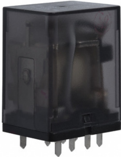
Image ကို ကိုယ်စားပြုခြင်းဖြစ်သည်။ ထုတ်ကုန်အသေးစိတ်သတ်မှတ်ချက်များကို ကြည့်ပါ။

K10P-11D55-48 Agastat Relays / TE Connectivity RELAY GEN PURPOSE DPDT 15A 48V K10P-11D55-48.pdf ခဲ / RoHS ကိုက်ညီပါရှိသည် 3366 pcs stock ဟောင်ကောင် DHL/Fedex/TNT/UPS/EMS